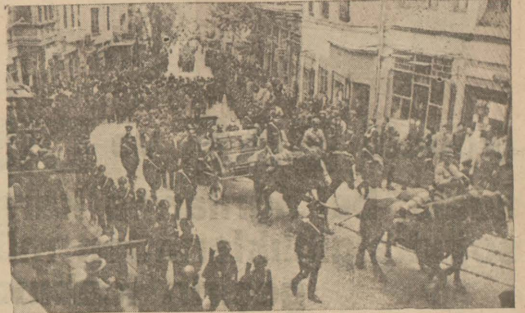
Cenaze merasiminden bir intiba

Osmanlı imparatorluğunun son sadrazam-larından müşir Salih (paşa) evvelki gün ve-fat etmiştir.