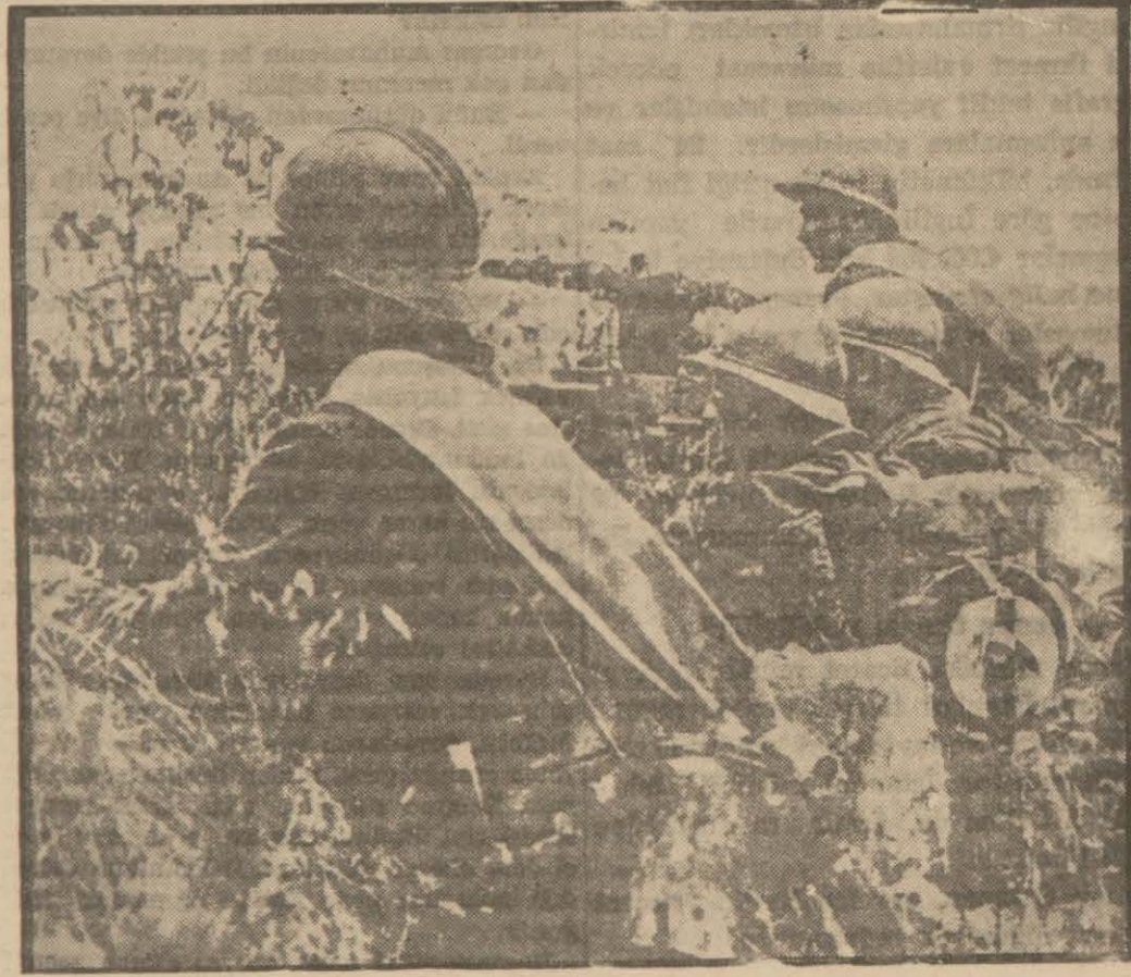
Fransız askerleri garb cephesinde

1939 Eylül Lehistan harbi, müstahkem cephelerin yokluğu ve Alman baskımanlığından bazı feci Leh hatalarına inzi mam eden büyük sevk ve idare failiye dolayısıyla, hem pek kısa sürmüş ve hem de sonuna kadar hareket harbi vasfını muhafaza etmişti. Fakat garb cephesi büyük orduların serbestçe açılıp hareket etmelerine kâfi olmadıktan başka üstel her iki tarafca tahkim edilmiş ol-